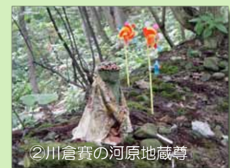
②川倉賽の河原地蔵尊