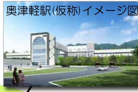
奥津軽駅(仮称)イメージ図