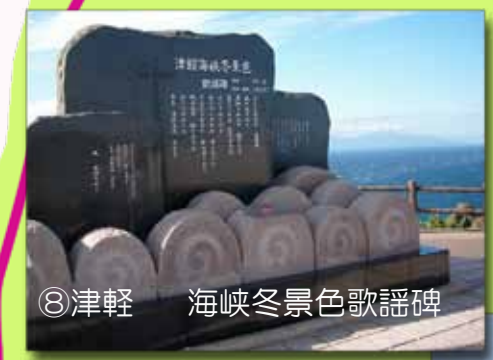
⑧津軽 海峡冬景色歌謡碑