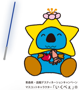
青森県・国産デザインキャンペーン マスコットキャラクター「いくべえ」®