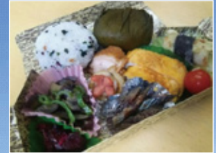
トレッキング用弁当付き