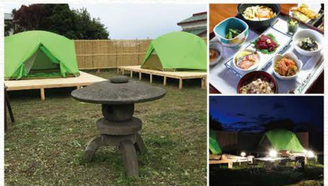
※亦能夠介紹農家民宿。歡迎洽詢詳情。

金木元氣村內備有露營場，以供遊客加倍享受鄉間生活的樂趣。在盡情享受附近的大自然後，夜宿在星空下的帳篷中，必定能夠令這趟旅遊增添更多趣味。晚餐可於「茶房鄙家」享用鄉土料理，沐浴則可利用鄰近的元氣村木屋。蟲鳴環繞，月光星光灑落，定會讓您在此留下一份美好回憶！