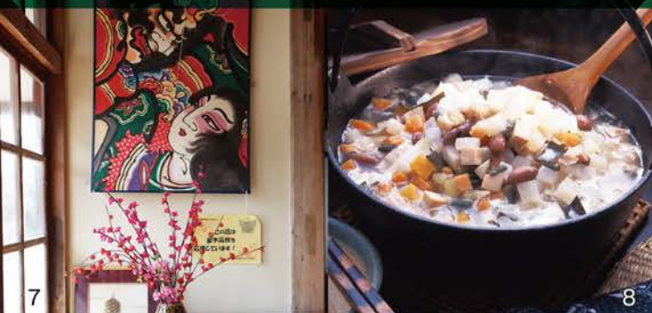
5.「茶房鄙家」是將金木元氣村「KADARUBE」內具有140年歷史的古民房整修而成。專門研發並銷售使用當地農畜產品製作的鄉土料理、點心。6.「茶房鄙家」的圍爐。可以在此烤魚、煮火鍋。7.「茶房鄙家」的一隅。8.「粥汁」是津輕地區的居民在入冬後特別喜愛的鄉土料理。使用的基本食材包括白蘿蔔、紅蘿蔔、牛蒡等青菜類以及鋒斗菜、蕨菜、莖菜等山菜類，以及炸豆皮、豆腐、凍豆腐等大豆製品。將所有食材切丁後燉煮，並以味噌、醬油調味，是道樸實的當地料理。